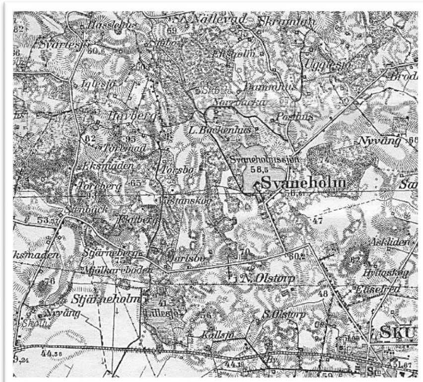
Gården Toreberg ligger rakt upp i linje med Svaneholm