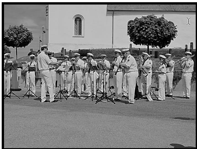
Malmö Spårvägs Musikkår