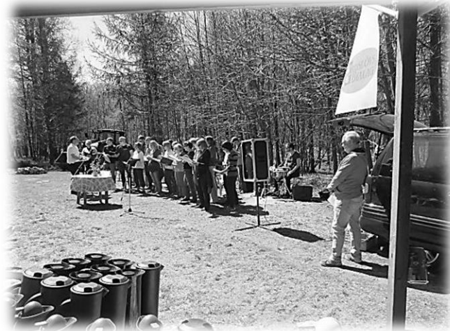
Gudstjänst med Gospelkören