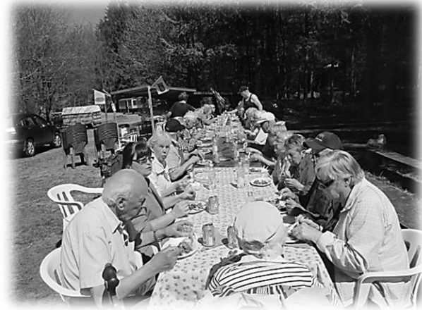
Våra vänner från Gröningen