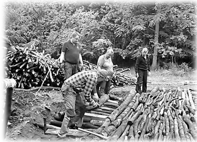
Bygge av kolmilan

Stort tack till alla för allt arbete med vår kolmila. Både gamla och nya kolare, spöken, kökspersonal, samt besökare