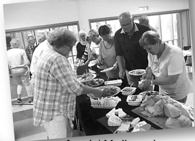
Lunch i Medborgarhuset