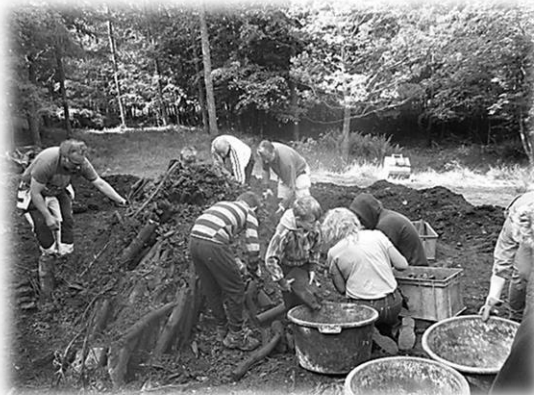
Rivning av kolmilan