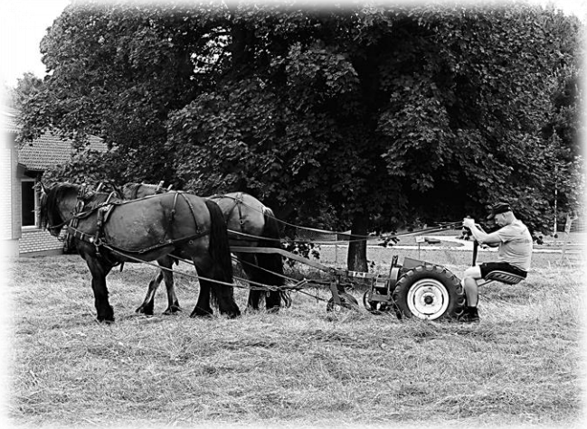
Sigvard och hans pojkar