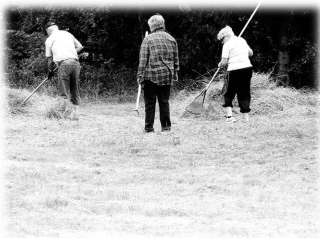
Våra trogna medlemmar i full gång