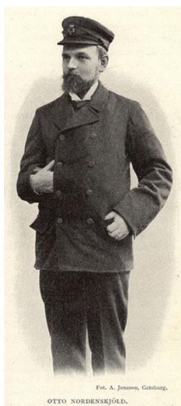
Otto Nordenskjöld, expeditions ledare

Den svenska expeditionen till Antarktis, ' Svenska Sydpolarexpeditionen 1901-1904 ', under ledning av Otto Nordenskjöld (1869-1928) var, trots sitt dramatiska händelseförlopp med dramatik i den högre nivån, en av Sveriges mest betydelsefulla polarexpeditioner i vetenskaplig mening. Trots namnet fanns inga ambitioner, till skillnad från den brittiska, att ens försöka nå Sydpolen. Valet av forskningsfält som Nordenskjöld gjorde var i verkligheten en plats i Antarktis så långt som möjligt från den geografiska sydpolen, nordspetsen av Antarktis-halvön. Den var dessutom den enda svenska expedition vilken kom att utrustas och avsegla till Antarktis under den s.k. " Heroiska eran " (1895-1922), den tid då man för transporterna var hänvisad till segelfartyg med hjälpmotor. Slädarna drogs av hundar och radiokommunikation var ännu ett okänt begrepp.