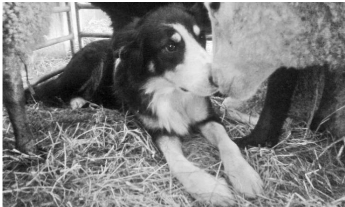
Elle med lamm. Samspel, tillit och förtroende!